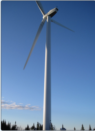
• Vue de l'éolienne T-2 haute de 80 mètres.