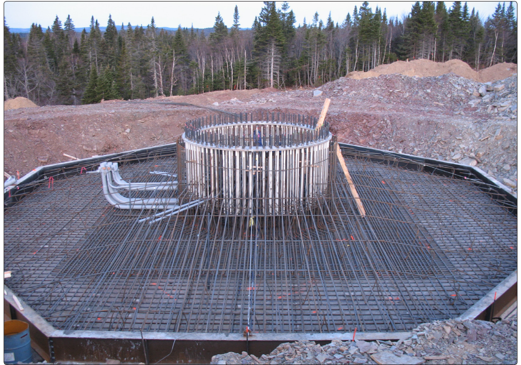
• Instrumentation de la fondation, de l'armature, des ancrages et de la tour.

Le SNEEC Corus est le « Site Nordique Expérimental en Éolien » situé dans la région de Gaspé qui évalue la performance et rendement des turbines en fonction des conditions climatiques du Québec sur leur rendement. Un des aspects importants de ce projet pilote est la compréhension du comportement structurale de cette conception dans notre région.