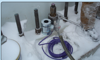
• Installation de cellules de charge aux ancrages.