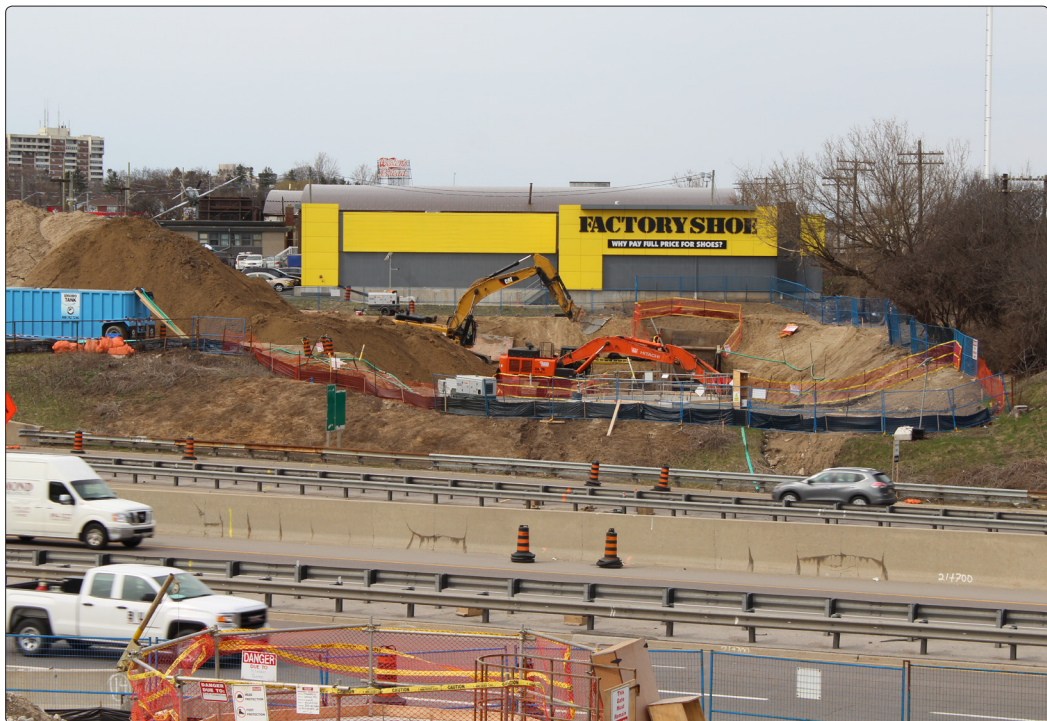
• Jonction des routes 85 et 7

Les services de GKM Consultants ont été retenus par la Dufferin Construction Company (DCC) afin d'effectuer les mesures de bruit et de vibration pour un contrat du ministère des Transports de l'Ontario (MTO) dans la Ville de Kitchener.