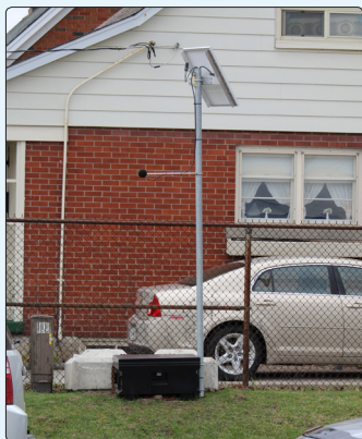
• Station automatisée de son et vibration