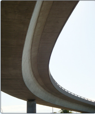
• Vue du Pont P-15210