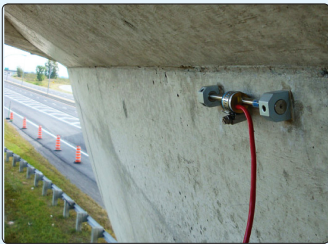
• Jauge de déformation à corde vibrante