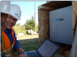
• Mise en route de l'acquisiteur de données et logiciel RDMS