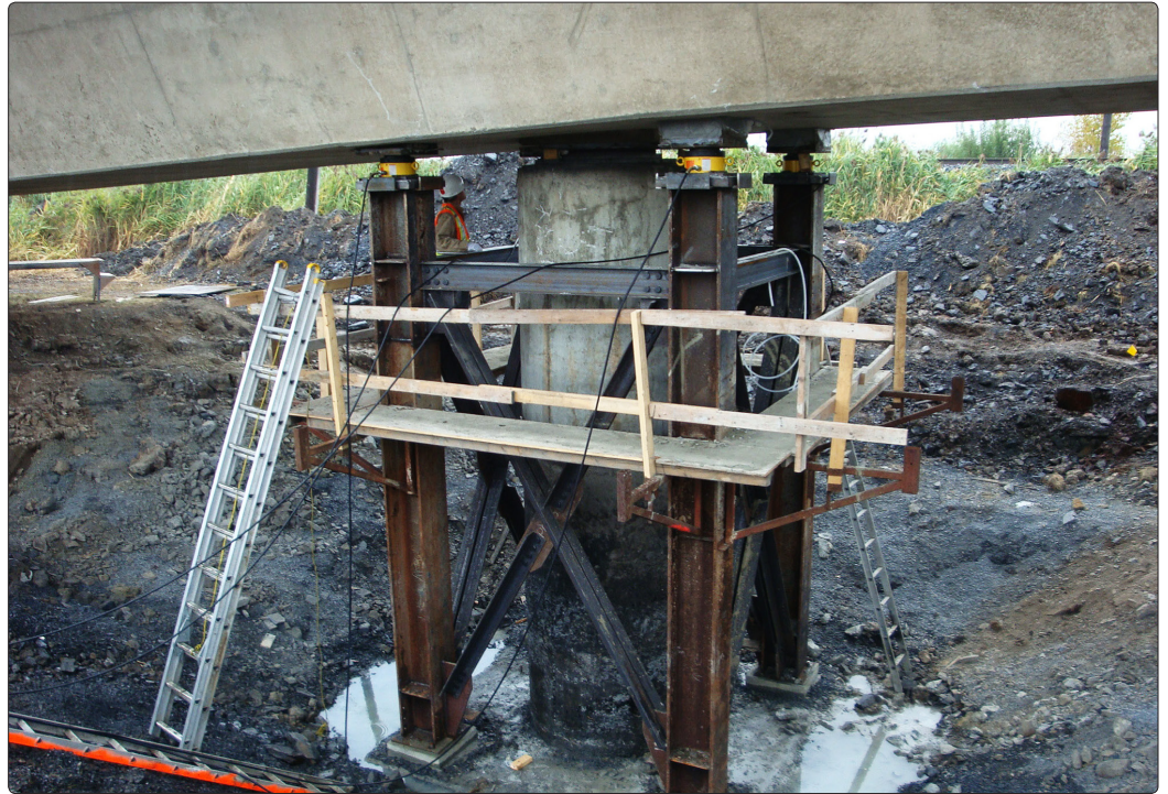
• Dispositif de levage pour la réfection de l'appareil d'appui Pile #2

Dans le cadre des travaux de réfections et remise en état du tablier et appareils d'appui existants du pont P-15210 qui enjambe la route 116 au Nord de l'autoroute 30, GKM Consultants a été mandatée par Construction Concrete Ltée pour suivre en temps réel les contraintes engendrées dans le béton durant les opérations de soulèvement du tablier.